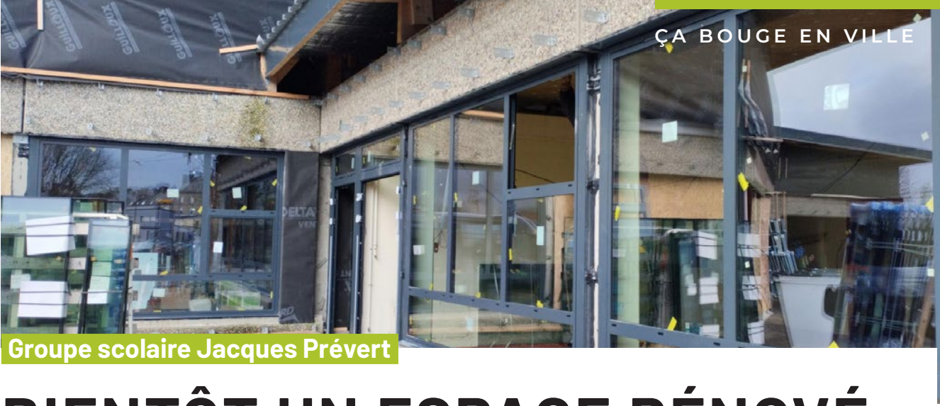
Groupe scolaire Jacques Prévert