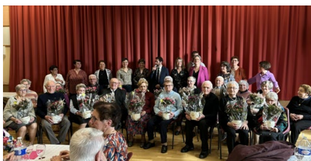
Photo : les personnes présentes âgées de 90 ans et plus ont reçu chacune de la part des membres du CCAS une azalée sur tige fournie par l'horticulteur « À la Pholie ».

Le repas était préparé et servi par Le Lion d'Or. M. Georges Michel DJ a animé la journée.