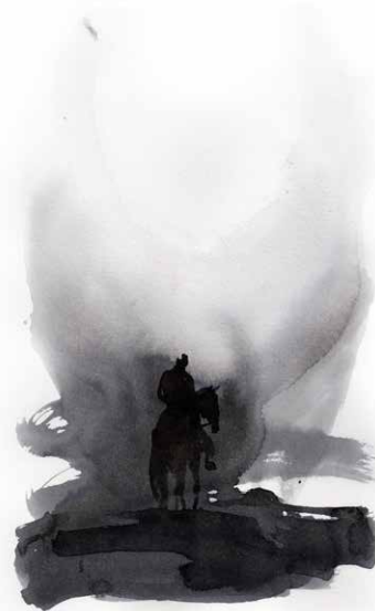
Illustration : Ernest Pignon-Ernest

Le festival « Sentiers Poétiques » vous intéresse ? Vous avez envie