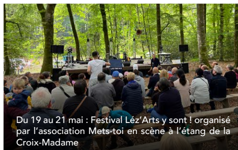
Du 19 au 21 mai : Festival Léz'Arts y sont ! organisé par l'association Mets-toi en scène à l'étang de la Croix-Madame