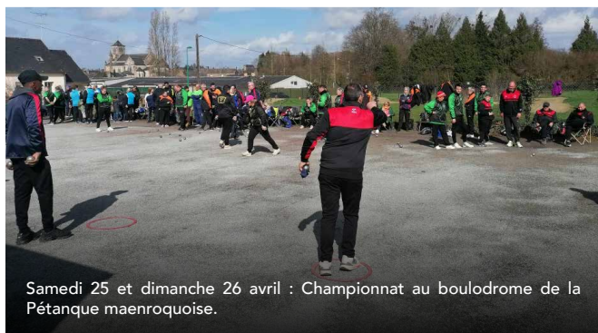
Samedi 25 et dimanche 26 avril : Championnat au boulo-drome de la Pétanque maenroquoise.