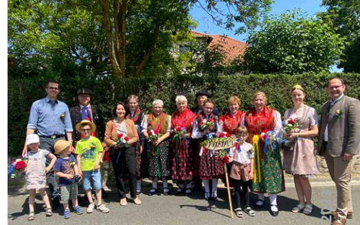
La représentation de Karlstadt avant le défilé pour les 50 ans de l'arrondissement