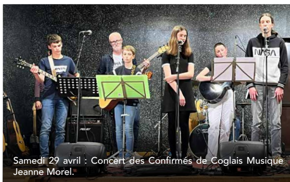
Samedi 29 avril : Concert des Confirmés de Coglais Musique Jeanne Morel.