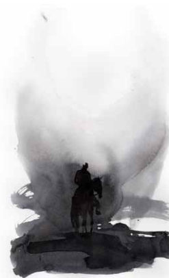
Illustration : Ernest Pignon-Ernest