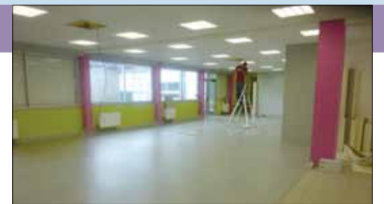
Les nouvelles couleurs du réfectoire

Cet été, la commune a procédé à la rénovation et remise en ordre des canalisations eaux usées et eaux pluviales de la salle de sports Raoul Maigne, rue d'Antrain. Celles-ci dataient de la construction de la salle en 1966.