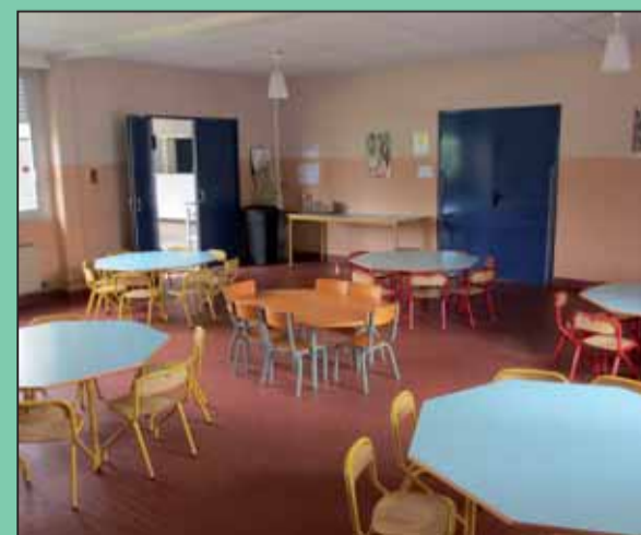
Réfectoire actuel de la maternelle