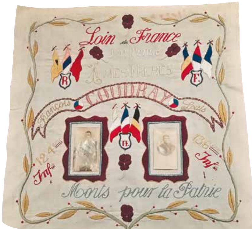
Broderie évoquant la mort de deux Stéphanois pour la Patrie (collection privée).