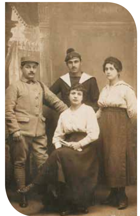
Portrait de deux frères et leurs épouses au début de la guerre. Une grande partie des hommes fût incorporée dans les différents régiments de l'Ouest.

Vous avez des souvenirs sur le Saint-Brice du début du XX e siècle, vous avez hérité d'objets et de lettres de vos grands-parents ou de la famille, vous avez des compétences en matière d'analyse de sources ou en scénographie, ou bien vous êtes tout simplement intéressé par cette période et voulez vous investir... Nous vous accueillerons avec plaisir ! Nous comptons sur vous ! ●